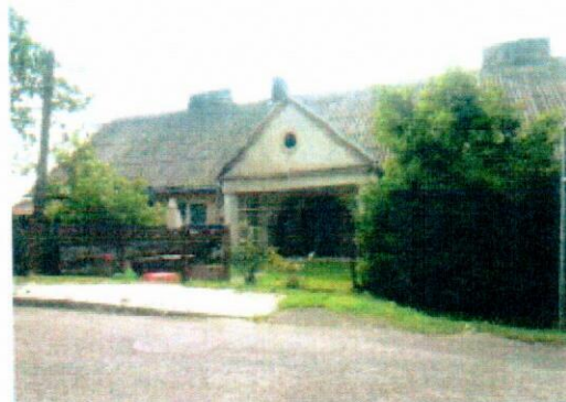
Wejście do budynku