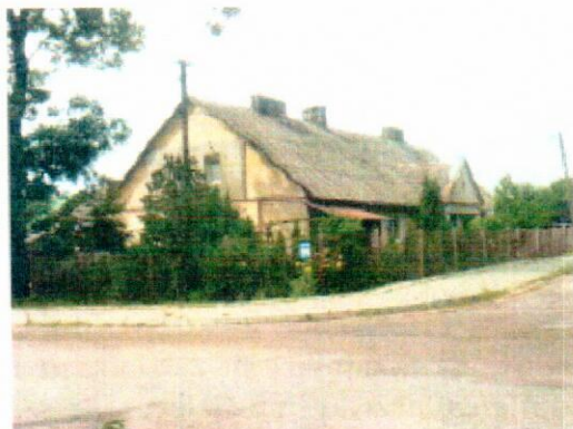
Widok od strony skrzyżowania