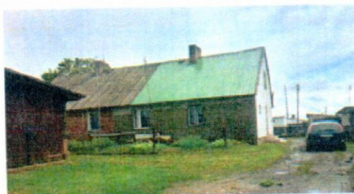
Budynek z zewnątrz