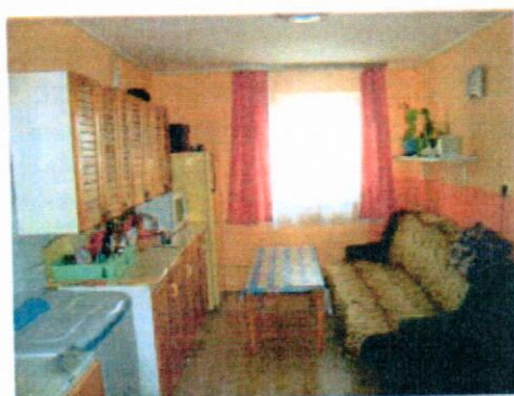
Mniejszy pokój z aneksem